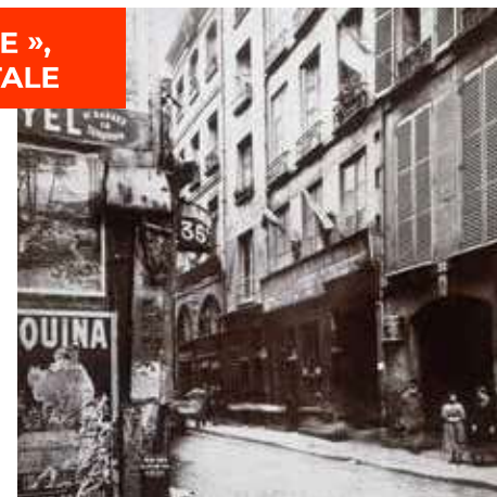
Immeuble au 24 rue Saint-Merri, entre 1895 et 1899

Ce cycle de conférences propose d'aborder les inégalités économiques et sociales et les discordances dans les modes de vie et les pratiques culturelles au cœur de cette nouvelle métropole.